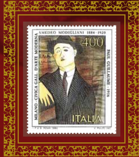
Stampa d'arte bozzetto del francobollo commemorativo di Amedeo Modigliani nel centenario della nascita emissione anno 1984